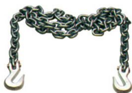
Art. 3002S | Catene di tiro Pull chains